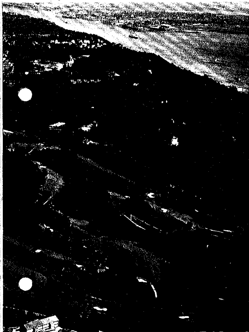
Il percorso di Falkenstein

ce, dopo aver superate, ha battuto in finale zzurri, che si sono ei «quarti», hanno ntissimo quarto posto