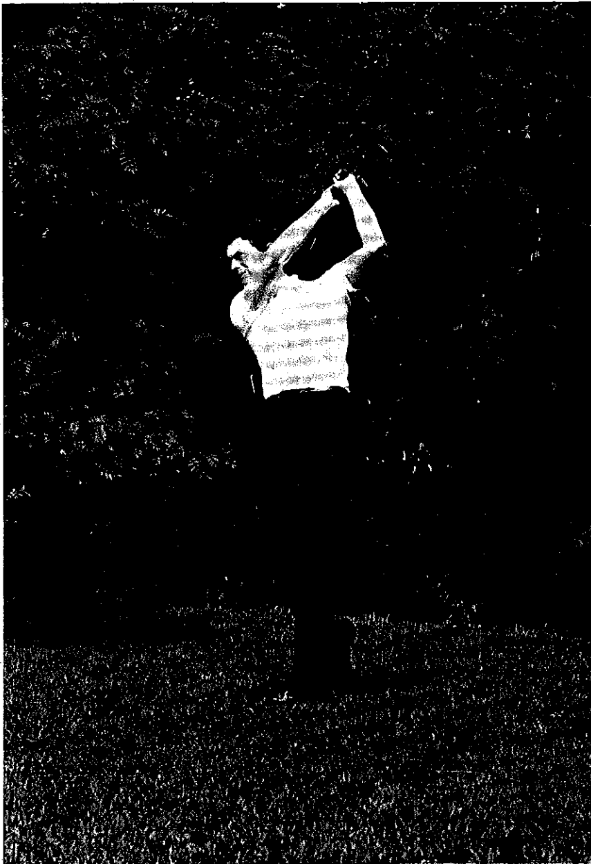
Il gallese Squirrel