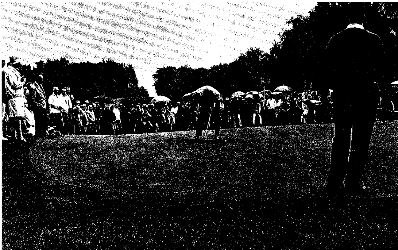
Un putt di Bonallack nel corso della finale

Schiaffino e Dassù, alternandosi in una serie pressoché perfetta di colpi lunghi, prendono quasi tutti i greens e, con il loro 36, sono due up a metà gara nei confronti di Walters e Stevens. Nelle seconde nove la superiorità dei due azzurri continua e, alla 16.a, il primo punto è nostro. Nell'altro match, Silva e Tadini trovano maggior resistenza da parte di Tucker e Squirrell. I due italiani, due up alla 11.a, perdono con tre putts la 13.a e, con un drive in bosco, anche la 16.a. Alla 17.a Squirrell si lascia sfuggire una occasione d'oro per vincere la buca sbagliando un putt di